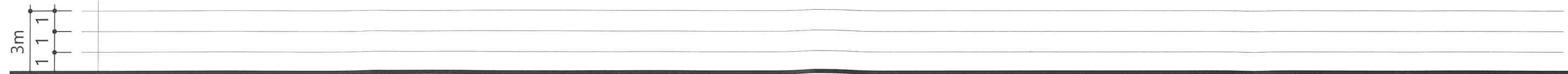
지하층의 지표면 산정도 축척: 1/200