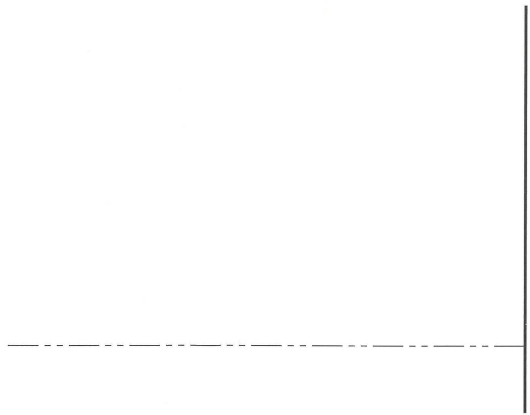
A-A'단면도 축척: 1/200